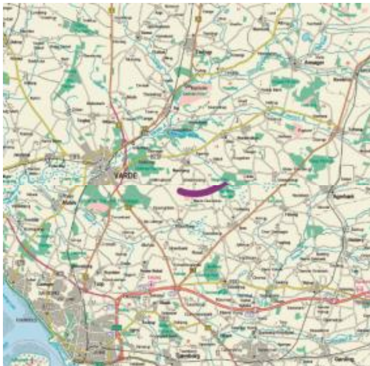
Figur 2. Lokalplanområdets beliggenhed er markeret med et lilla bueslag