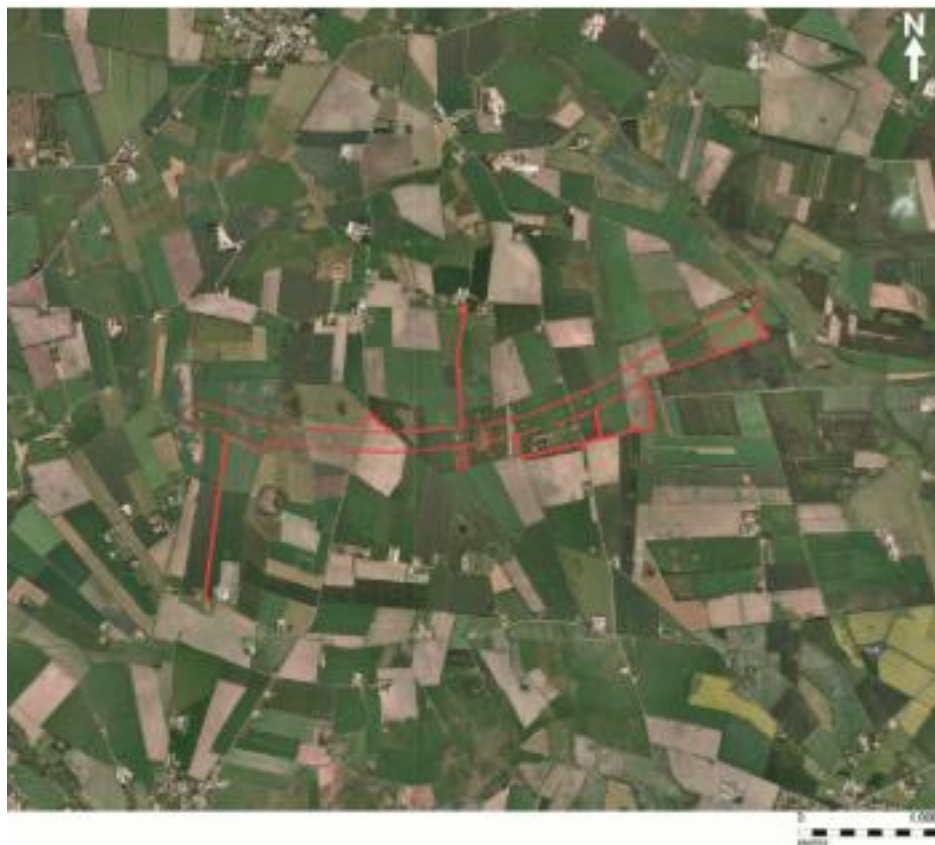
Figur 1. Lokalplanområdets afgrænsning.

Varde Kommune har modtaget ansøgning om tilladelse til opstilling af ti nye vindmøller med en totalhøjde på op til 149,9 meter og en minimumseffekt på 3,0 MW pr. vindmølle. Formålet med denne lokalplan er således at tilvejebringe det planmæssige grundlag for opstilling af vindmøller af denne størrelse med henblik på at fremme en CO 2 -neutral energiproduktion i Varde Kommune.