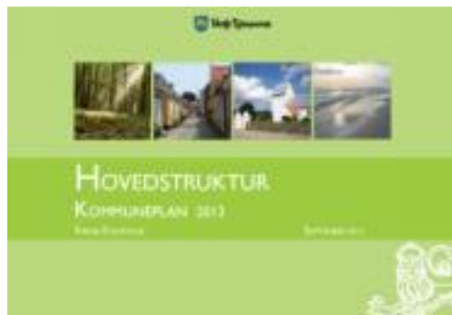
Figur 4. Kommuneplan 2013, Varde Kommune