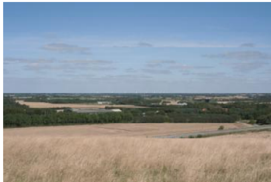
Figur 7. Visualisering mod nordøst fra Lyshøjen ved Esbjerg. Afstanden til nærmeste planlagte vindmølle ved Ulvemose og Bækhede Plantage er ca. 11,7 km.

de Kommune vil i VVM-tilladelsen stille krav herom. Stop af vindmøllerne i perioder med generende skyggekast ved naboer vil give et betydningsløst produktionstab.