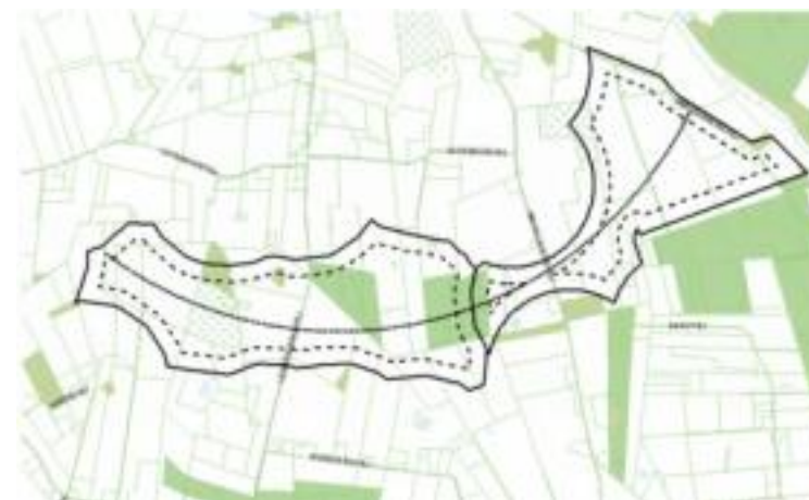
Figur 5. Områdekort fra kommuneplanens retningslinjer for vindmølleområderne A og A2.