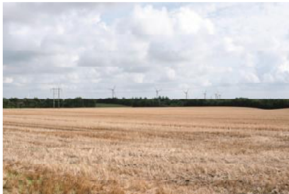
Figur 6. Visualisering mod nordøst fra Roustvej. Afstanden til nærmeste planlagte vindmølle er ca. 3,0 km.

De nærmeste eksisterende vindmøller til de nye vindmøller står ved Møgelbjerg nord for Bækhede Plantage. Der er ikke fundet et visuelt uheldigt samspil med denne vindmøllegruppe.