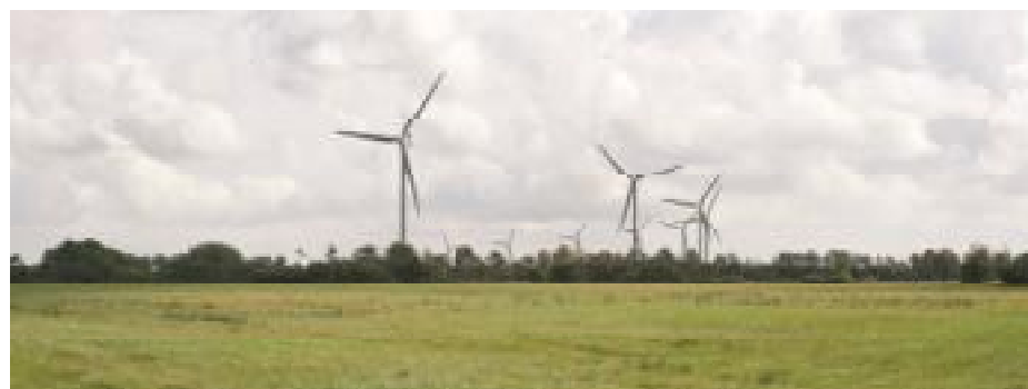
Figur 3. Visualisering mod øst fra Vardevej mellem Knoldeflod og Rousthøje. Afstanden til nærmeste vindmølle er ca. 1 km.

Øvrig belysning af vindmøllerne er af landskabelige hensyn ikke tilladt, ligesom møllevingerne skal overfladebehandles for at reducere refleksion af sollyset.